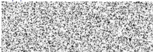
..... vedoucí Pobočky Hradec Králové